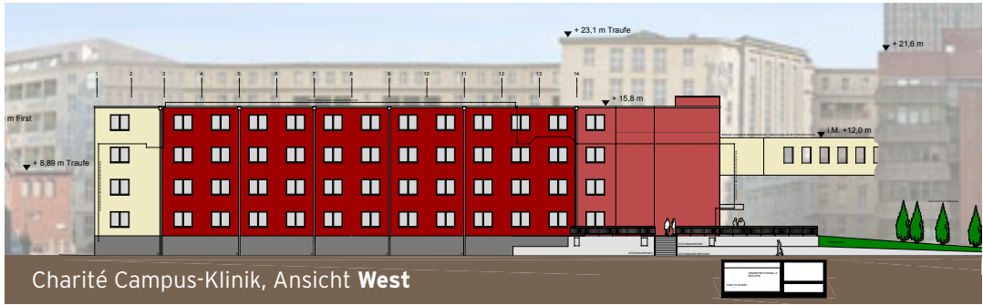
Charité Campus-Klinik, Ansicht West

Im Herbst 2013 beginnen die umfangreichen Umbau- und Sanierungsmaßnahmen am Bettenhochhaus der Charité. Für die weiterhin gute Versorgung der Patienten während der Bauzeit wird die Charité Campus-Klinik errichtet, die ab dem Frühjahr 2013 auf dem historischen Campusgelände am Standort Mitte entsteht.